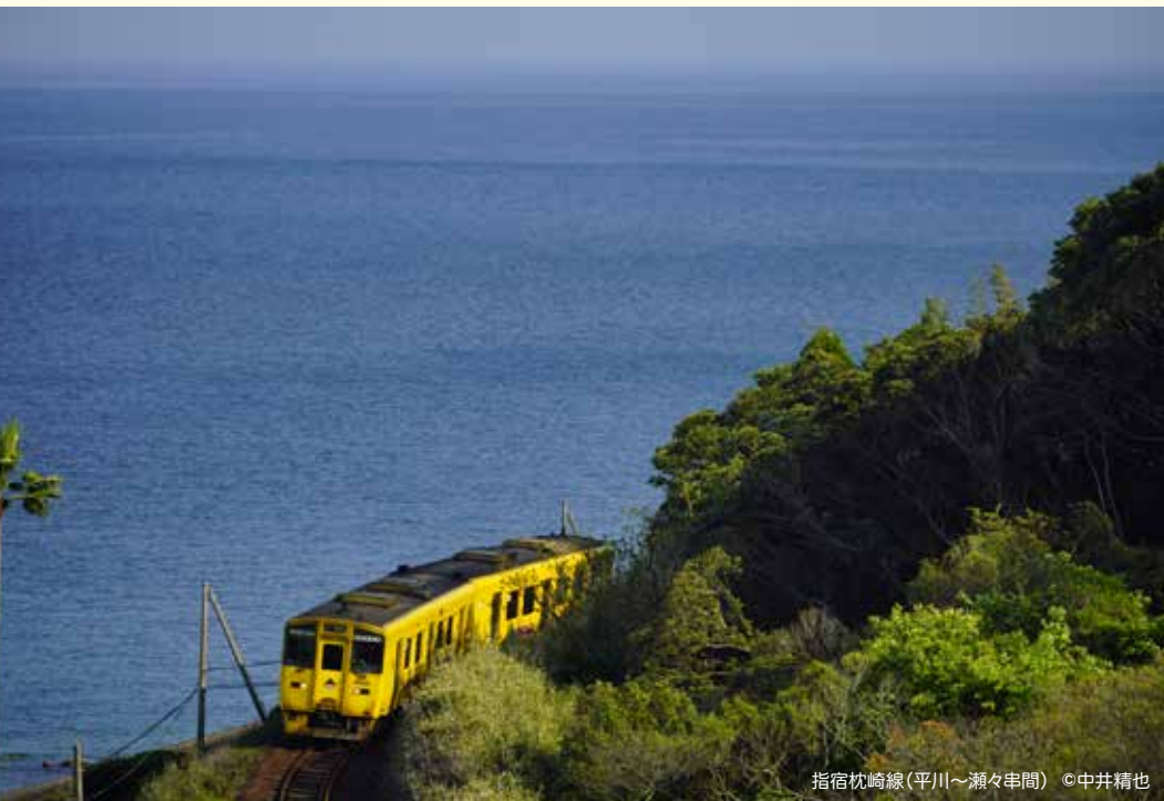
指宿枕崎線(平川～瀬々串間)